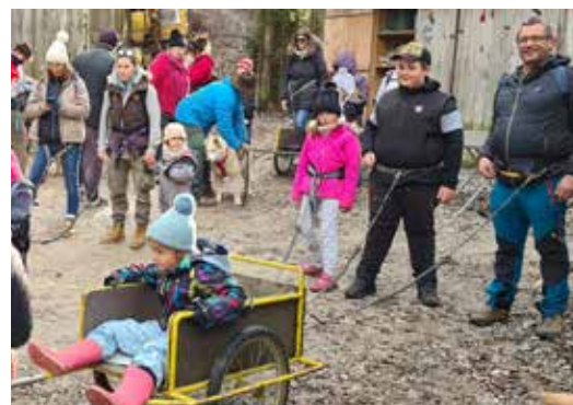
Distribution de papillotes par le Père-Noël