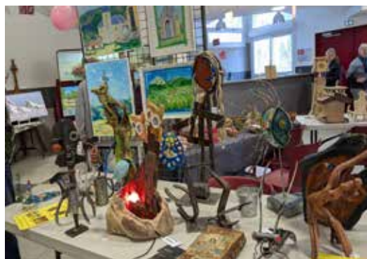
Exposition des talents locaux