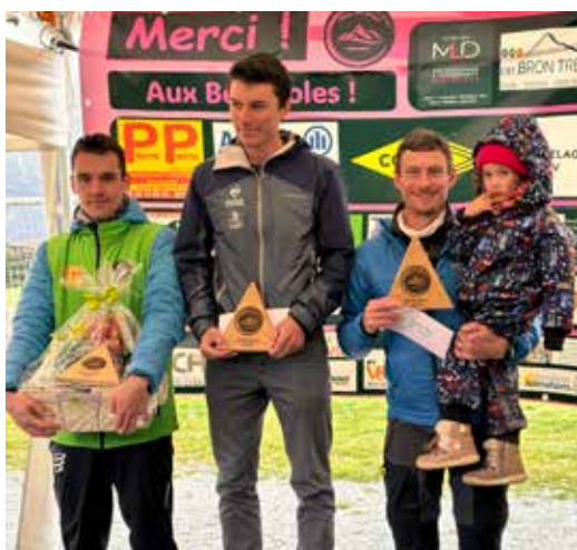
Trail de Reyv'