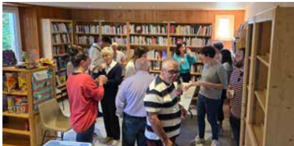
Inauguration et animation jeux ludothèque