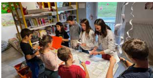
Atelier créatif d'Halloween