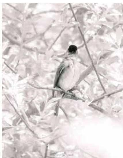
Fauvette à tête noire