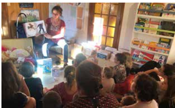
Animation autour du festival du livre