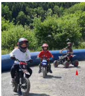
Jeux de Reyv'