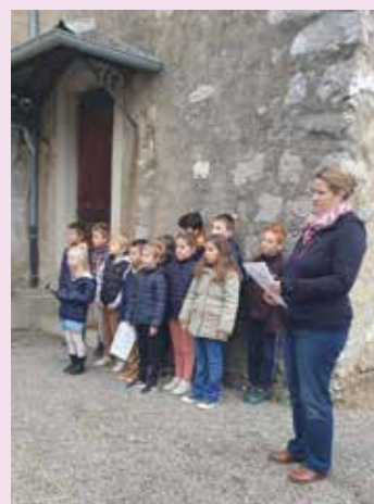
Cérémonie 11 novembre