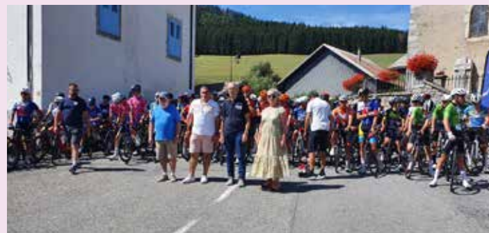
Tour du Léman junior