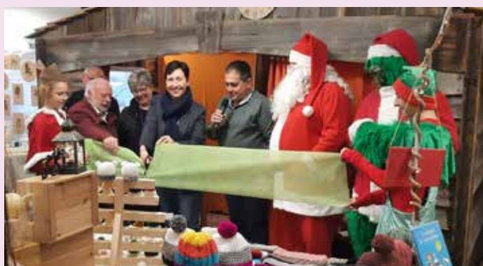
Marché de l'Avent