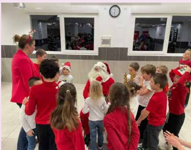
Spectacle de Noël